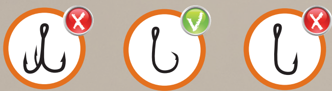
Trépied Treble hook