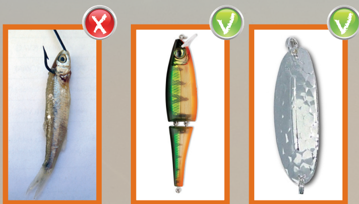
Appât naturel Natural bait