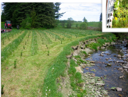
Bande riveraine en milieu agricole, nouvellement aménagée

Pour obtenir des renseignements supplémentaires, contactez votre OBV local.