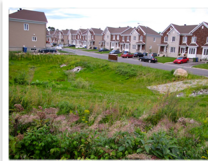
Bassin de rétention

Pour obtenir des renseignements supplémentaires, contactez votre OBV local.